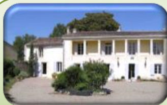
Chambre d'hôte: G33157 «Campagne»

Journée Portes Ouvertes dans nos hébergements Convivialité, Partage et Découvertes seront au programme !