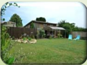
Gîte: G3201 «Campagne»