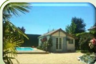
Chambre d'hôte: G33145 «CityBreak»

74, avenue Gustave Eiffel, 33560 SAINTE-EULALIE (BORDEAUX)