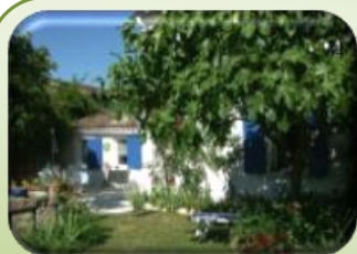
Gîte: G4223 «Campagne»

12 avenue du parc d'Espagne, 33600 PESSAC (BORDEAUX)