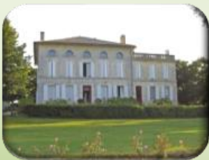
Chambre d'hôte: G33273 «Bien-Etre»