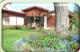
Gîte: G3139 «Jardin d'Exception»

103, Deyma, 33550 VILLENAVE-DE-RIONS (ENTRE-DEUX-MERS)