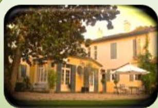
Chambre d'hôte: G33271 «Bien-Etre & Charme»

8 bis, hameau de La Hâge, 33420 ST-AUBIN-DE-BRANNE (LIBOURNAIS)